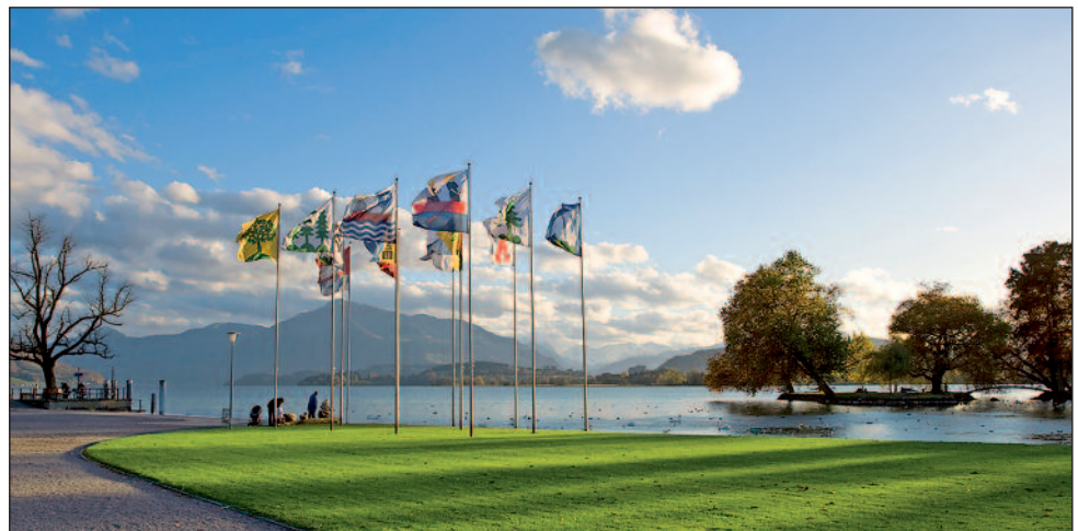
Samstag, 12. Juni 2010 feiert Shinson Hapkido das 20 Jahr-Jubiläum im Hirsgarten.

(Komplettes Grusswort ist auf der Shinson Hapkido JUBI-FEST Webseite publiziert)